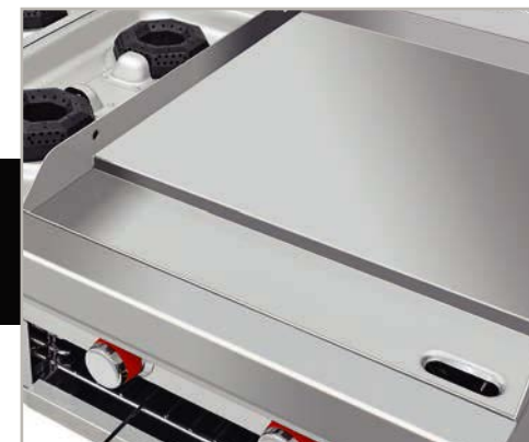
Plancha con exclusivo sistema para recolectar grasa y residuos.